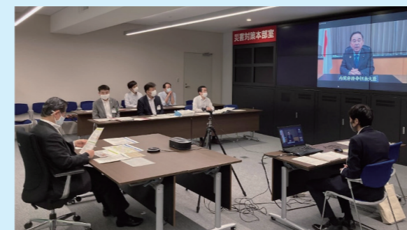
認定証授与式(オンライン)の様子

*「SDGs未来都市」とは、国(内閣府)が、SDGsの達成に向けた優れた取組を提案する都市を「SDGs未来都市」として、毎年度、30程度選定するもの。