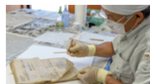
貼りついた和紙を1枚1枚剥がす作業

被災直後に現場で応急処置がされているものも、再度処置が必要だったり、絵図などノリで貼ってあったものがバラバラになってしまっていて、開いた後に