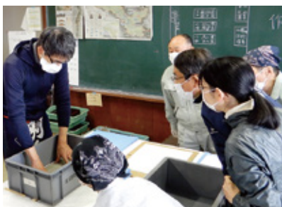
専門家による資料の応急処置のワークショップ

台風により浸水被害にあった掛軸、屏風、仏像、古文書、典籍など各種文化財の応急処置を行い、保全する活動です。被災地から搬入された資料の多くは、劣化を防ぐため業務用の冷凍庫に一時保管されています。現在いる12名ほどのメンバーのほとんどは、これまでこのような活動に携わったことのない素人ですが、各方面の専門家の指導を受け、解凍の手順からカビの処置、乾燥まで、細かい技術や知識を習得して、徐々に作業ができるようになりました。博物館の所蔵品ではない民間資料を対象に、ボランティアが中心となって活動している例は全国的にも稀です。歴史資料を保存し、後世に伝えることの大切さを感じています。