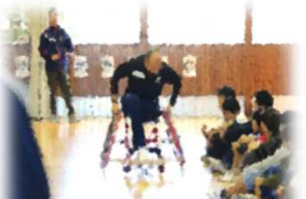
重点取組6(1) パラスポーツ出前講座