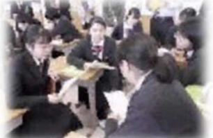
重点取組3(1) 考え議論する道徳