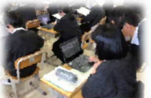
重点取組2(1) 一人一台端末の利活用