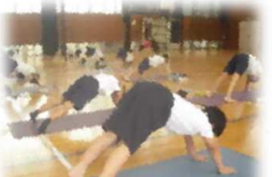
重点取組4(1) 体力向上グッと！プラン