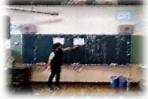
オンラインによる学習支援