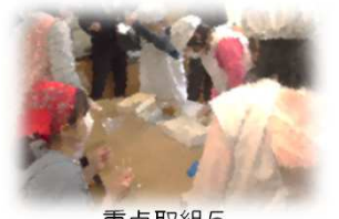
重点取組5 特別支援学級の授業改善