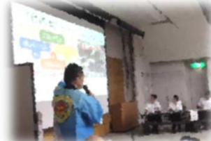
コミュニティスクール推進セミナー